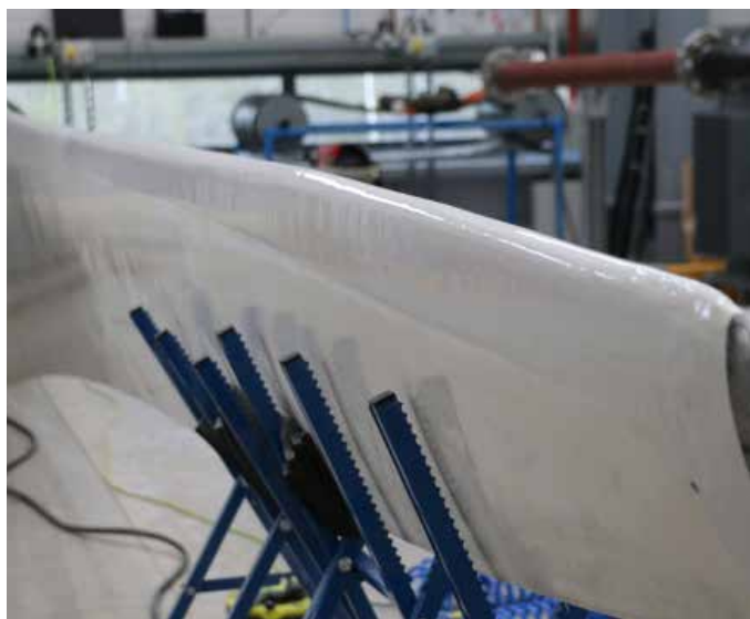
贝尔佐纳(Belzona) 5721 提供两种颜色 - 白色和浅灰色(RAL 7035)