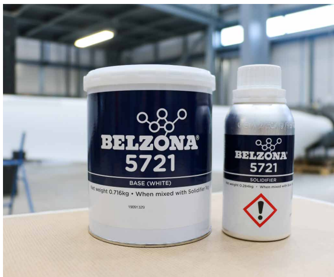
贝尔佐纳(Belzona) 5721 的包装规格经过优化， 适合于原位施工